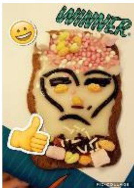
Björn Schutte uit groep 8b won de wedstrijd 'speculaaspop versieren'.